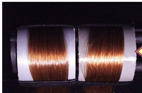
ルビトールライト処理