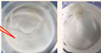
Matrifuse™ S-1あり Matrifuse™ S-1なし