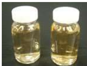
MQ2001 2%添加 ブランク 5 回洗浄