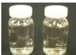
MQ2001 2%添加 ブランク 10 回洗浄

毛束を市販シャンプー(ブランク)と、市販シャンプー+MERQUAT 2001 (2%)にて毛髪を洗浄