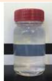
NaCL=3%添加時の外観写真