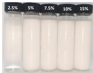
No Clay + Emulsifiers