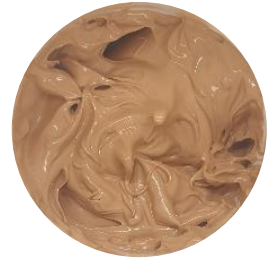
With BENTONE® LUXE WN