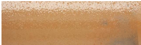
Foundation with emulsifiers and no clay