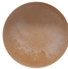
Without Clay, with Emulsifiers