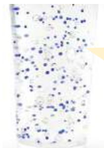
45°C×1日後のビーズの状態