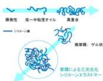
不定形エラストマータイプ