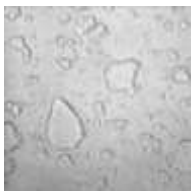
特殊ブレンドタイプ