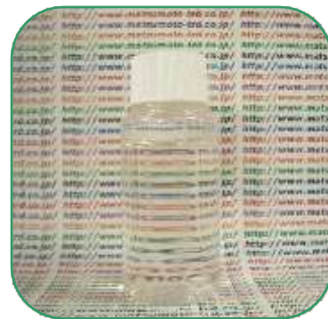
アミノ酸系透明シャンプー (GENAPOL DEL 3%配合)