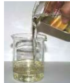
ハンドリング性の高い液状原料

アミノンC-11S は、シャンプーの補助界面活性剤です。 モノエタノールアミドと比較して、常温液体で取り扱いが簡単で、 低温・高温条件下での安定性も高くなっています。 ジエタノールアミドと比較してもシャンプーの増泡性、速泡性、 増粘性のいずれにしても優れた効果を示します。