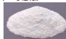
プレミックスタイプ