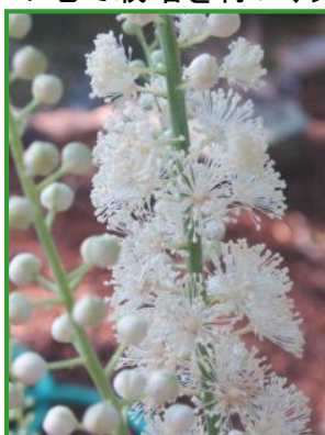
【アメリカシヨウマ】

「Native American Eco-Line(ネイティブアメリカンエコライン)」が誕生したのは、ネイティブアメリカンの薬草利用に発想を得たことに始まります。100種類を超えるリストの中からピックアップされた9種類の薬草の種を、アメリカ大陸よりはるばる大西洋を越えた南アルプスに輸送。さらに厳しい有機農園の制限をクリアするため、この地で栽培を行い、天然水を使用。低温抽出による特別な抽出を経て、 水と植物だけの究極のオーガニックエキス が完成しました。これにより Ecocert Organic の認証を取得しております。