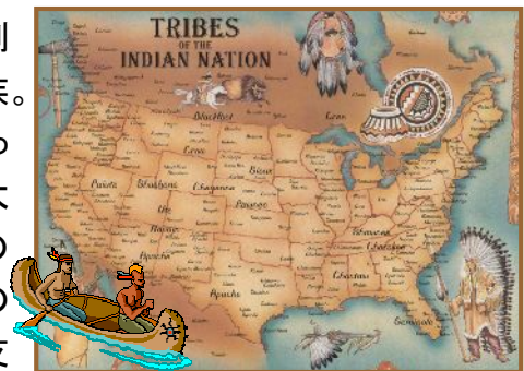
【ネイティブアメリカンの生活に欠かせない薬草に発想】

「ネイティブアメリカン」、コロンブスの北アメリカ大陸到着以降インディアンと呼ばれるようになった古の民族。自然とともに生き、自然とともに暮らすその彼らにとって、植物は極めて普遍的な存在であり、その力を最大限に引き出す術を知り尽くしているといえます。その代表ともいえるべき「シャーマン」や「コクーン(女性のヒーラー)」、怪我や病に苦しむ人々を助け、信仰を支える重要な立場にあった彼らにとって不可欠であったのが膨大な数に上る薬草です。